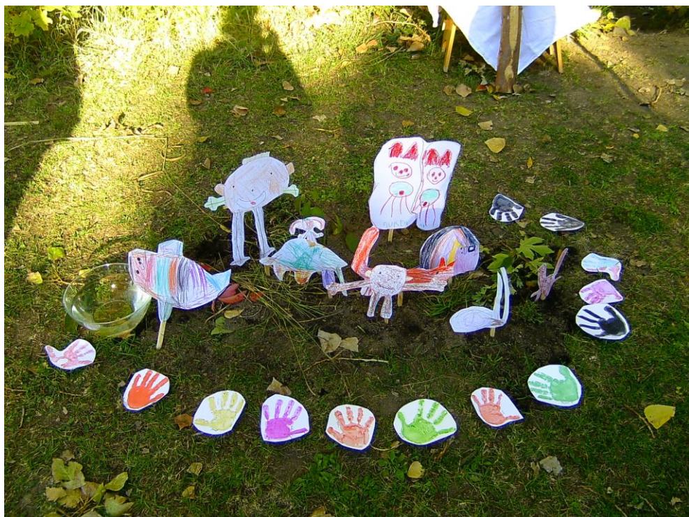
„Altarbild“ des Eröffnungsgottesdienstes zum „Netteprojekt“

Früchte des Glaubens - ein „bunter Strauß“ Kirche